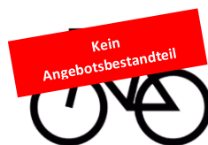
2. Fahrzeuge (Elektrofahrräder)