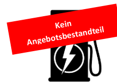
3. Ladeinfrastruktur (optional inkl. Ökostrom)