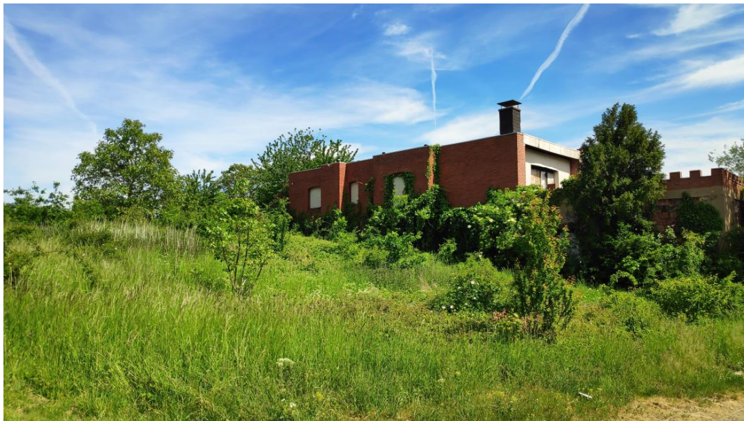
Abbildung 2: Blick auf das Weincastell mit vorgelagertem Gehölzaufwuchs, Blickrichtung Südosten

Der Änderungsbereich befindet sich auf Flur 9, Flurstück 52 und umfasst eine Größe von ca. 1,1 ha. Die Fläche wird im Westen, Süden und Osten durch landwirtschaftliche Wegeparzellen begrenzt. Im Norden grenzt eine weinbaulich genutzte Fläche an. Im Zuge der Aussiedlung eines landwirtschaftlichen Betriebes wurde auf dem Grundstück Ende der 1970er Jahre ein Weinkeller genehmigt, der anschließend um ein zusätzliches Geschoss aufgestockt wurde. Das Grundstück ist durch die baulichen Anlagen, einen brachgefallenen Gartenbereich mit Baumbestand sowie einem brachgefallenen Wingert im rückwärtigen Bereich charakterisiert. Das Gelände fällt von Nord nach Süd-Südwesten von ca. 250 m ü. NN auf ca. 237 m ü. NN ab.