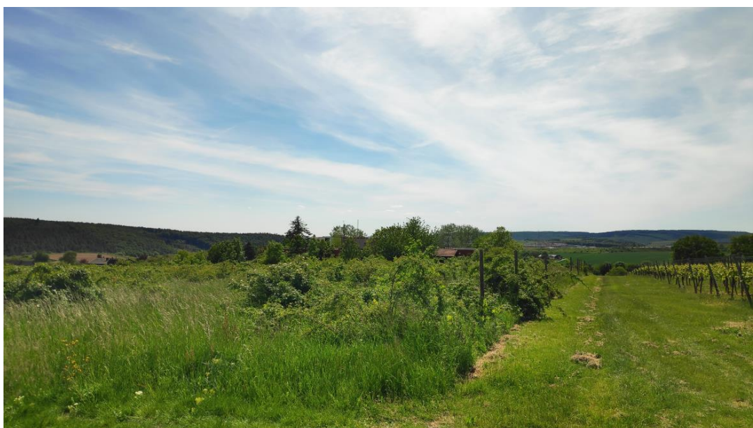
Abbildung 3: Blick über die Weinbergsbrache auf das Weincastell, Blickrichtung Südwesten, durch den Baumbestand auf der Gartenbrache ist die bauliche Anlage kaum sichtbar