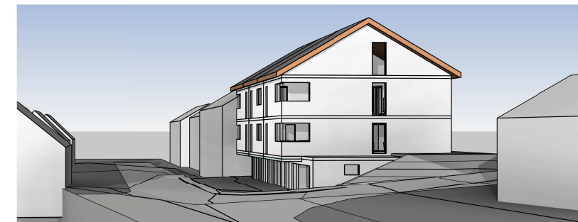
Straßenflucht Blickrichtung Nord - Süd